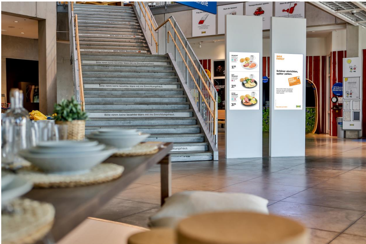
Einrichtungshaus Augsburg – Eingang